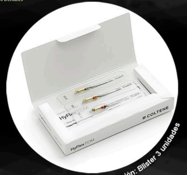
Presentación: Blister 3 unidades