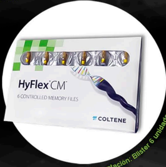
Presentación: Blister 6 unidades