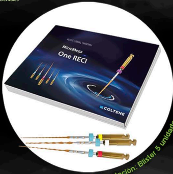
Presentación: Blister 5 unidades