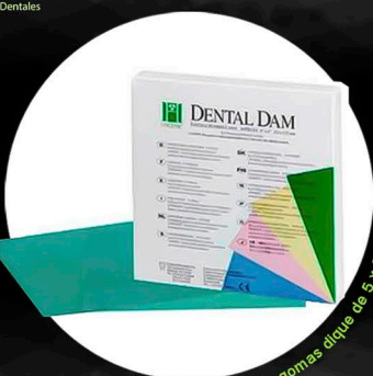
Caja con 52 gomas dique de 5 x 5