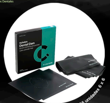
Caja con 36 unidades 6 x 6